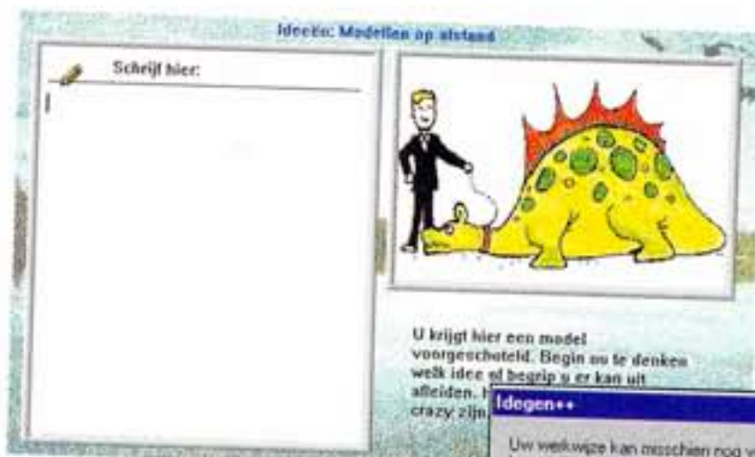
Verschillende stappen in het denkproces